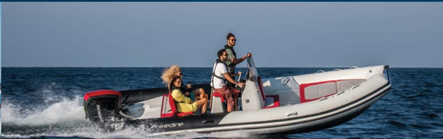
MEDLINE 660 COLOR