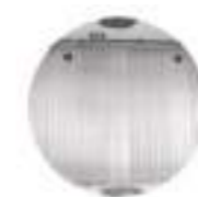
Alu En aluminium, plaques démontables