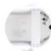
Aéro Gonflable haute-pression