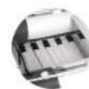
Roll-Up À lattes, enroulable sur lui-même